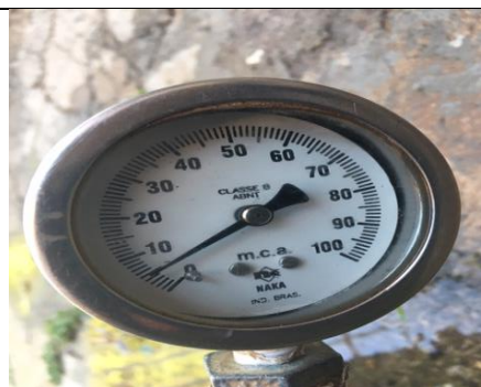
Rua João Zambelli, n° 560