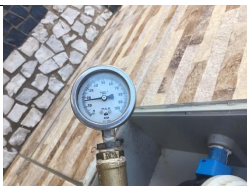
Rua Reinaldo Massoneto, n° 800