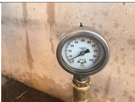
Rua João Zambelli, n°570