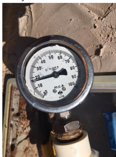
Rua Ignácia Zadra Fonseca, 135