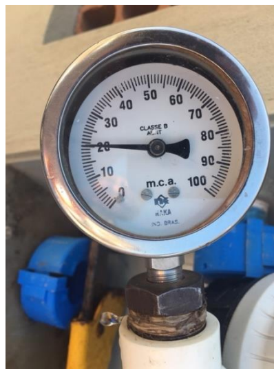
Rua Izaurina Machado, 130