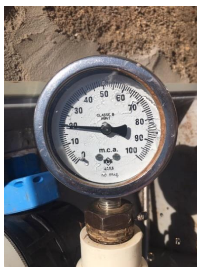
Rua Isaltina M. de Oliveira, 115