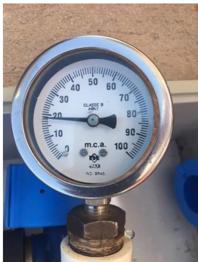
Rua Adélia T. Silvestre, 30