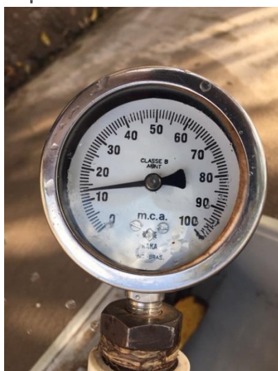
Rua Giovana Latauro, 335

Foram realizadas 06 (seis) aferições em endereços aleatórios definidos pela ARMPF no momento da fiscalização.