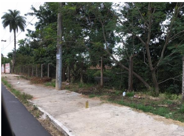
R. João Simão, 606