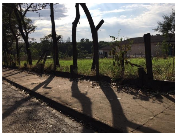
Av. Dr. Ademar de Barros, 230