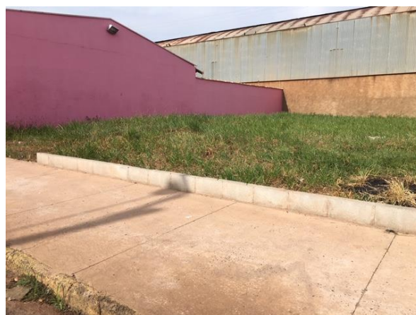
Rua João Bento da Fonseca, 65