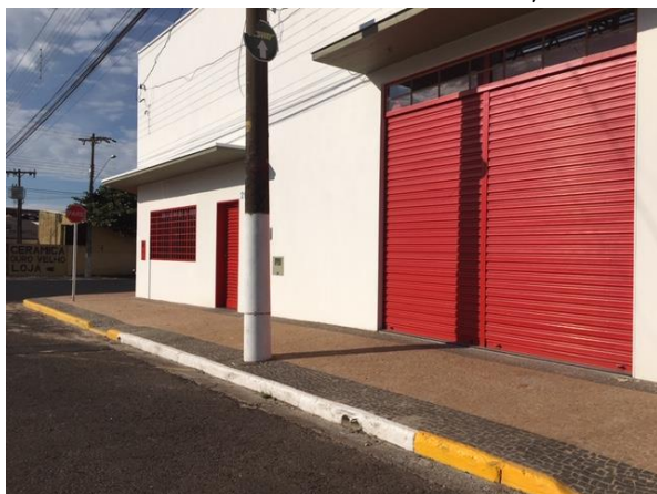
Av. Prof. Henrique da M. F. Junior