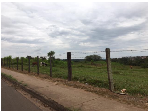
Av. Redugelo, 27