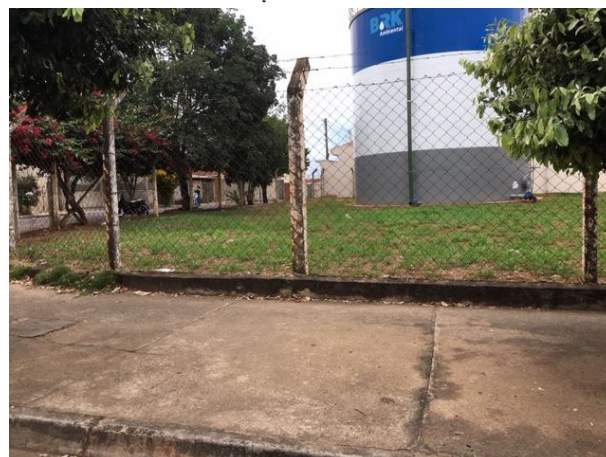
R. José Gomes, 395