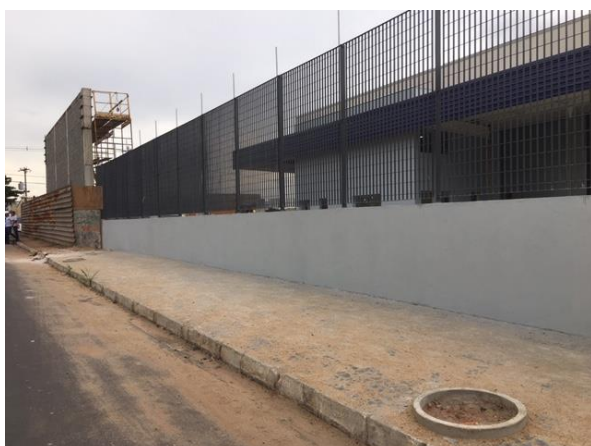
Av. Ademar de Barros (defronte à maternal)

Foram vistoriados 57 (cinquenta e sete) pontos. Dos 57 (cinquenta e sete) pontos vistoriados 05 (cinco), ou seja, 8,77% (oito virgula setenta e seta por cento) não estavam afixados nos locais definidos no contrato de concessão, sendo todos os pontos não encontrados pontos simples.