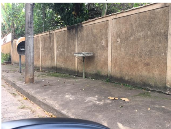
Rua Nossa Senhora Aparecida, 1785