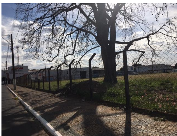
R. Nelson Pereira Lopes, 1213

Foram vistoriados 54 (cinquenta e quatro) pontos de embarque/desembarque. Dos 54 (quarenta e quatro) pontos vistoriados 08 (oito), ou seja, 14,81% (quatorze virgula oitenta e um por cento) estavam Não Conforme (NC), não estavam afixados nos locais definidos no contrato de concessão, sendo todos os pontos não encontrados pontos simples.