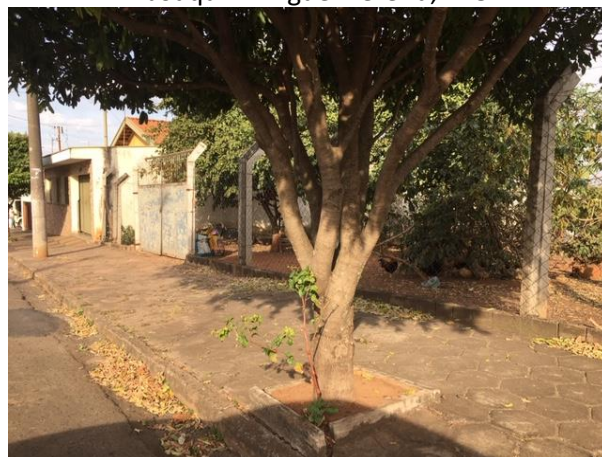
R. Marcolino Mariano, 189