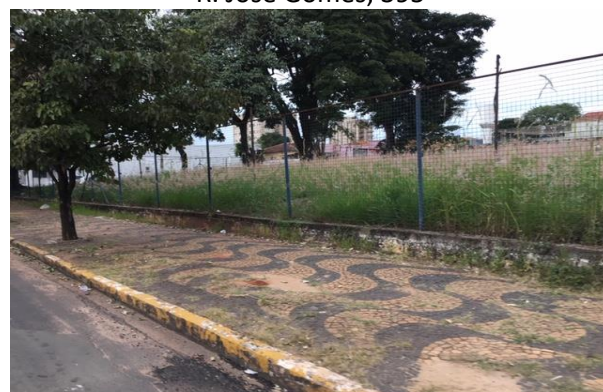
Av. Eng. Nicolau De Vergueiro Forjaz, 642-734 (Escola)