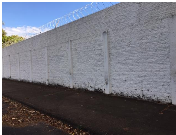
Rua Manoel Tangerino, 2374