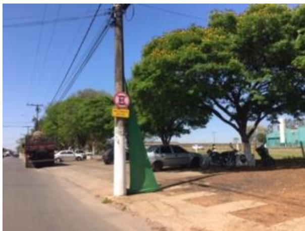
Av. João Martins da Silveira Sobrinho, 2525