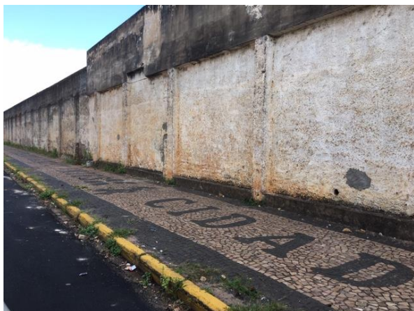
Rua Bento José de Carvalho, 2063