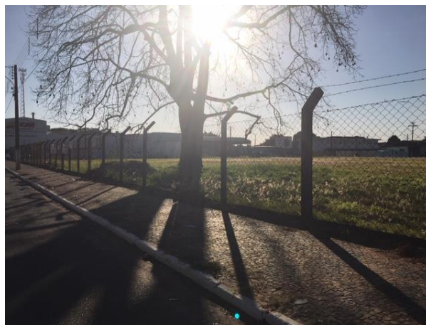
R. Nelson Pereira Lopes, 1213