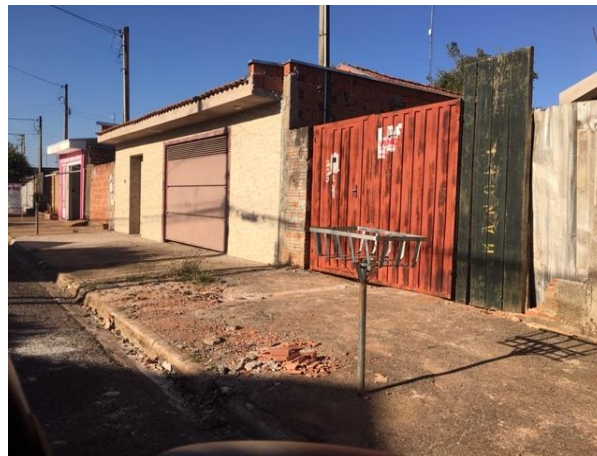
R. Claudionor da Silva Borges, 210