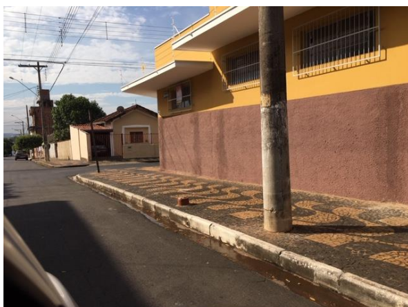
Rua Indalécio Rezende, 520

Foram vistoriados 53 (cinquenta e três) pontos. Dos 53 (cinquenta e três) pontos vistoriados 05 (cinco), ou seja, 9,43% (nove virgula quarenta e três por cento) estavam Não Conforme (NC), não estavam afixados nos locais definidos no contrato de concessão, sendo todos os pontos não encontrados pontos simples.