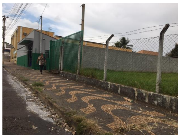
Av. Dr. Ademar de Barros, 245