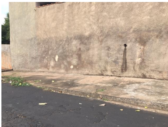
Rua João Bento da Fonseca, 701