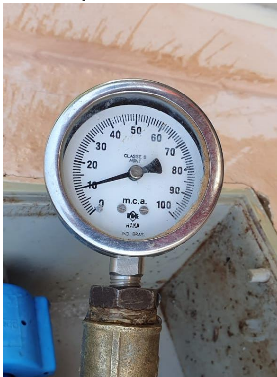
Rua Antônio Tavares, nº 248