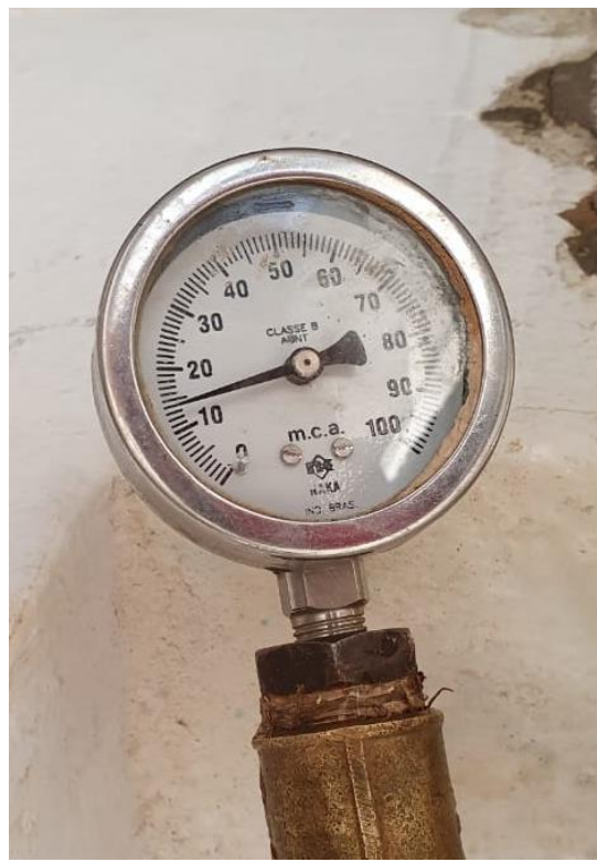
Rua Dr. José de Paula Castro, nº 217