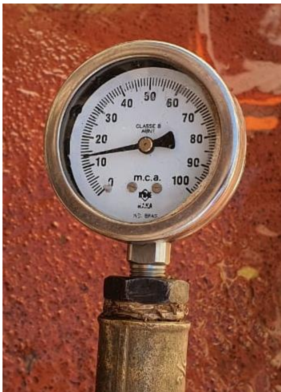
Rua Bento José de Carvalho, nº 1745