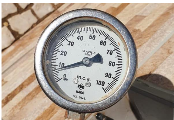
Rua Reinaldo Massoneto, 800