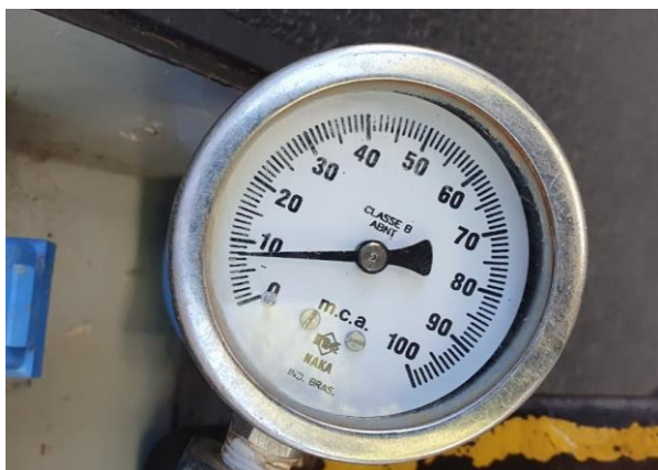
Av. João M da Silveira Sobrinho, 311