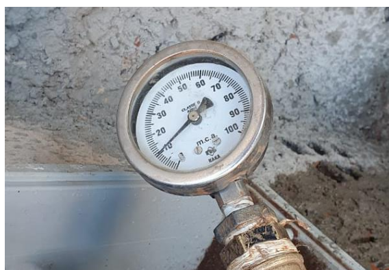
Rua João de Lima Filho, 761