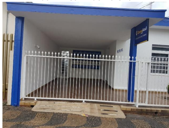
Central de Atendimento