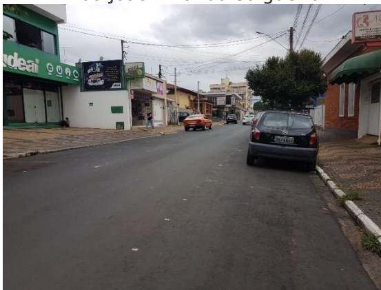
Rua Francisco Prado