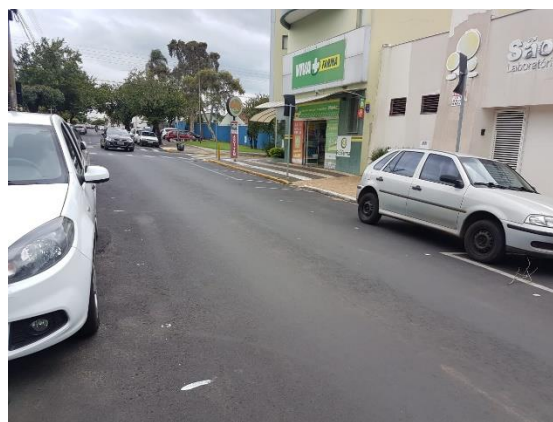
Rua Dr. Carlindo Valeriani